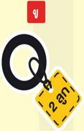
ลูกยางกันซึม 1.5 นิ้ว 2 ลูก