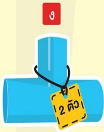
ข้อแยกสามทาง 1.5 นิ้ว 2 ตัว