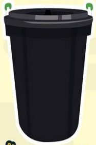
ถังน้ำ 66 ลิตร